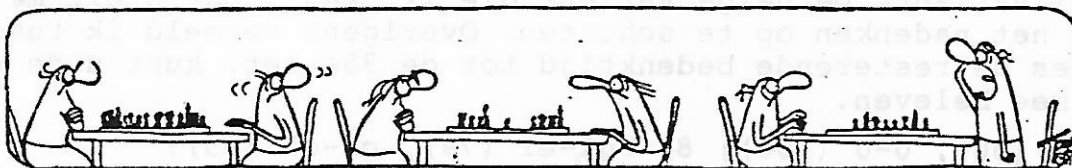
KRIJG PIJN IN ME MARSSEN VAN DAT GETUUR OP DIE ROTPOPPETJES!